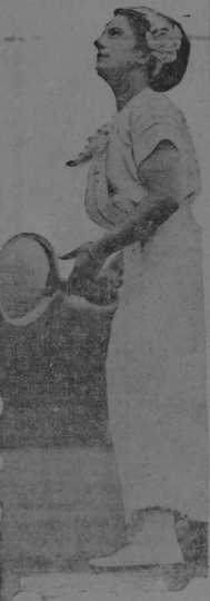
SRTA. HAZEL HOTCHKISS campeona en el juego de tennis, quien contraxera matrimonio, según la prensa de San Francisco con un estudiante de la Universidad de Harvard.