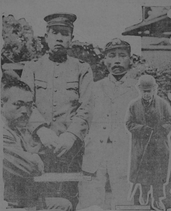
Nuestro grabado representa al Teniente japonés Shirase y dos de sus acompañantes en la expedición al Polo Sur. A la derecha al Capitán Scott junto con Shirase y Amundsen forman el grupo de tres héroes que han glorificado su nombre batiendo los hielos del polo.